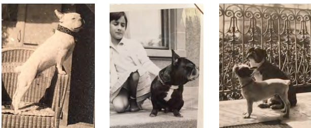
Illustration 2: photos prises en dans les années 30 et 60. Les nez sont assez allongés

Mais malheureusement, plus de la moitié des chiens brachycéphales sont importés de pays ne respectant pas les lois sur la protection animale ou proviennent d'élevages non certifiés.